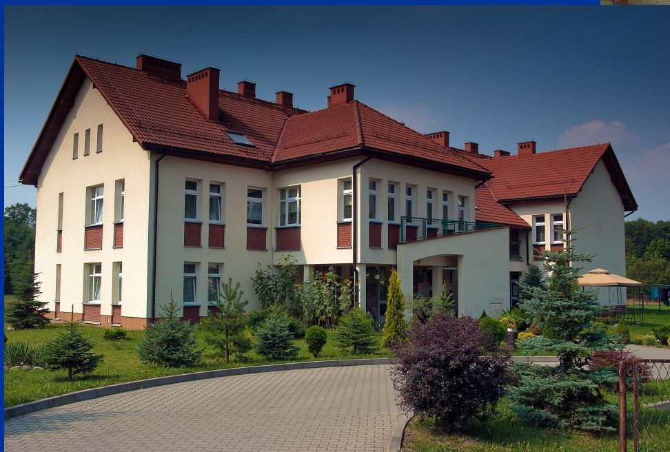
Budynek C (50 osób)