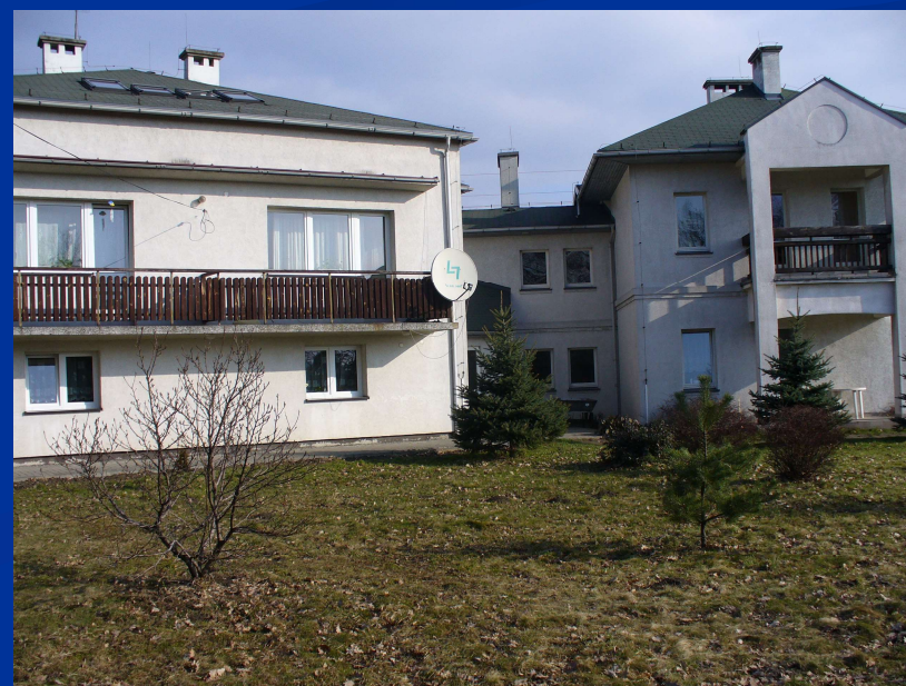
Budynek przy ul. Dębowej (30 osób)